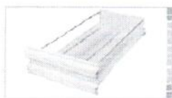
Ящик двойной высоты с МДФ дном 2 ящика в колонке