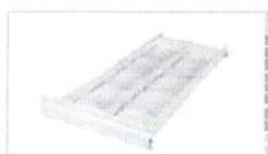
Ящик с МДФ дном 8 ящиков в колонке